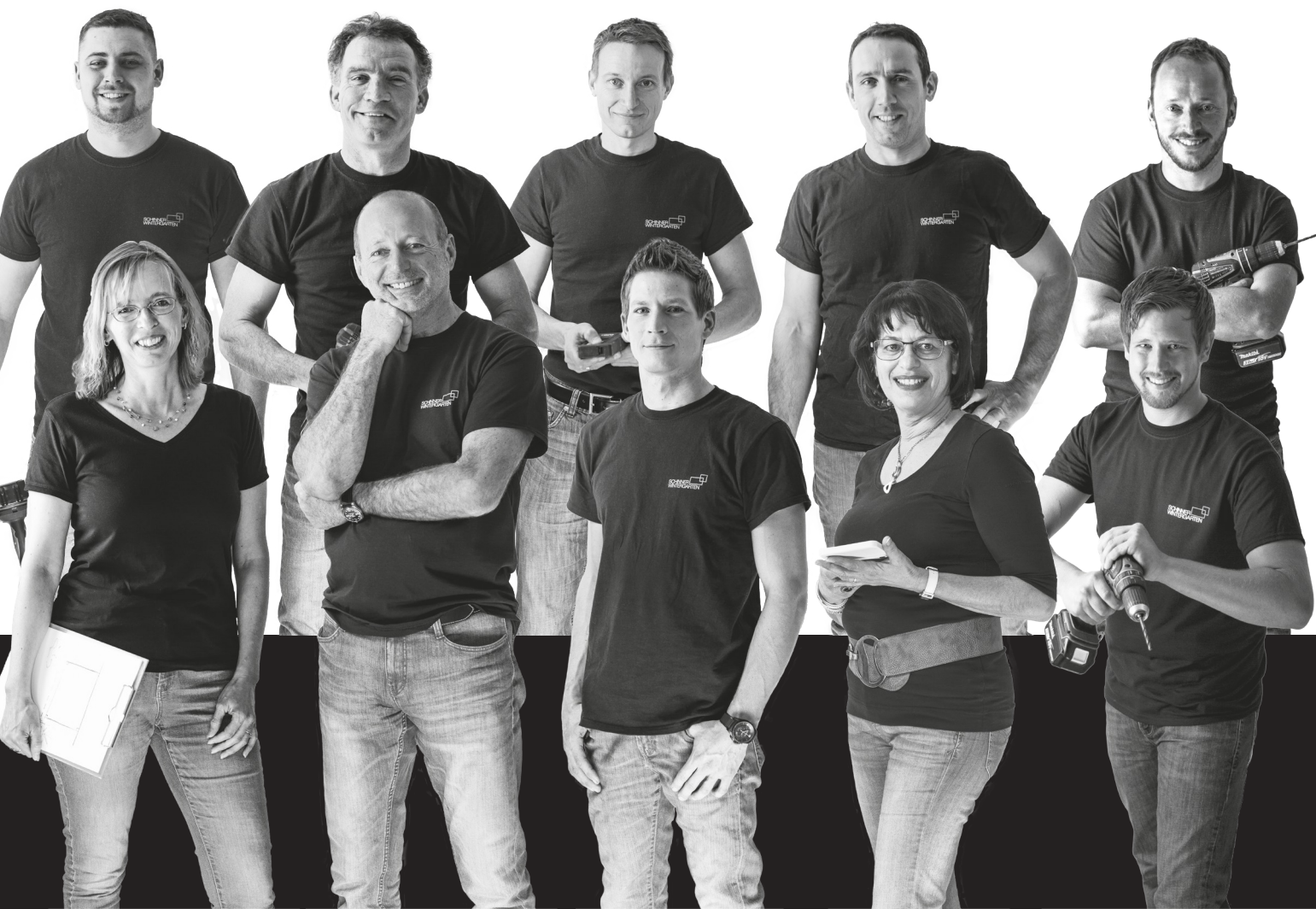
Elisabeth Auer Planung